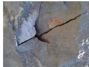
1. Classificato: Simone De Simone