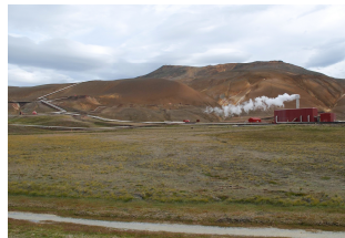
2. Classificato: Viola Oggioni