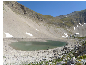
1. Classificato: Luigi Di Nuzzo