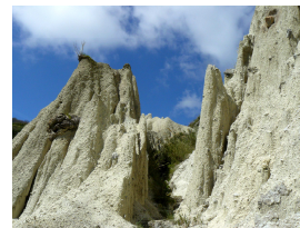
3. Classificato: Roberto Pellino