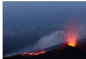
2. Classificato :Simone Genovese